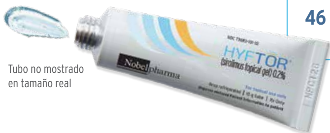
Tubo no mostrado en tamaño real

HYFTOR® debe aplicarse en la piel de la cara afectada por angiofibroma dos veces al día, por la mañana y a la hora de acostarse.